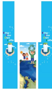
防紫外線可拆卸貼紙 成品例子