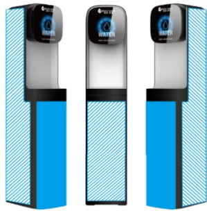
裝飾尺寸面積 (尺寸：見上圖藍色區域)